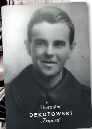
Hieronim DEKUTOWSKI „Zapora”

i niezależną ojczyznę. Istotny jest kontekst ich działania oraz ich wizerunek, w dużej mierze utrwalany przez propagandę komunistyczną. Dziś możemy dyskutować o niektórych postaciach czy działaniach II konspiracji , zastanawiając się, czy były one jednoznacznie pozytywne. Zapewne nie wszystkie działania podejmowane przez żołnierzy II konspiracji są zrozumiałe czy akceptowalne. Jednak większość z tych ludzi podejmowała akcje z myślą o niezawisłości, pomimo widocznej przewagi wroga i braku wsparcia z zewnątrz. Ostatni poległ w latach 60-tych . Najdłużej walczył Józef Franczak „Lalek” , zabity na Lubelszczyźnie w 1963 r. Pozostali, zakonspirowani lub objęci amnestią czekali na dogodną sytuację wznowienia działań. Wielu z nich wspierało KOR i ROPCIO oraz rodzącą