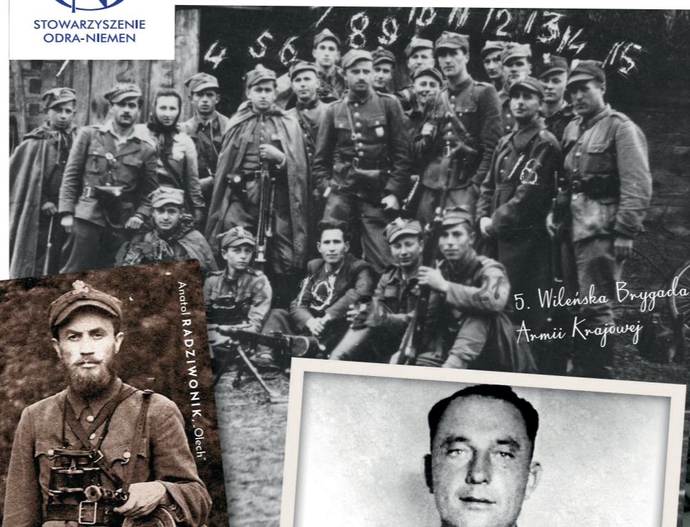
5. Wileńska Brygada Armii Krajowej

Pomysł i teksty: Stowarzyszenie ODRA-NIEMEN, odraniemen.org Projekt graficzny i dobór ilustracji: Katja Niklas, Ula Zalejska-Smoleń layoutexpress.pl