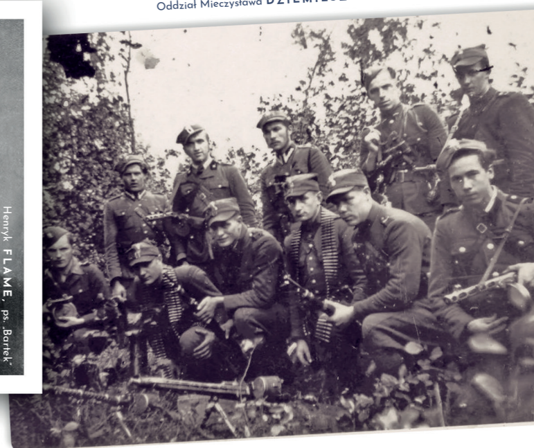
Oddział Mieczysława DZIEMIESZKIEWICZA, ps. „Rój”