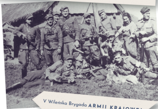
V Wileńska Brygada ARMII KRAJOWEJ